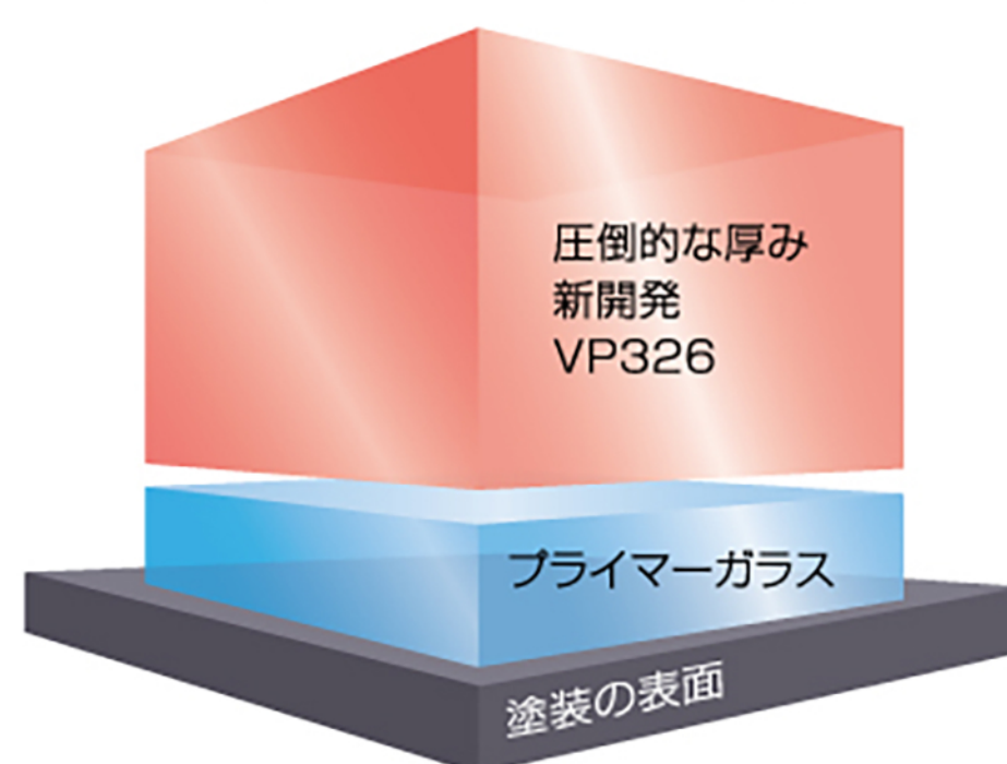
【EXキーパーのメカニズム】

今までのコーティングでも十分な艶を出すことができますが EXキーパーは、塗装の上に透明なベールを纏ったような、 それはもう「過剰 (EXCESS)」と呼ぶほどの圧倒的な艶を作り出しました。 車の塗装が持っている美しさを引き立てるだけでなく、 コーティング自体が存在感を持つ、車史上初めての美しさです。