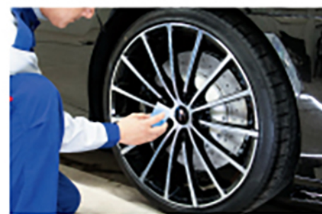
2 アルミホイール4本